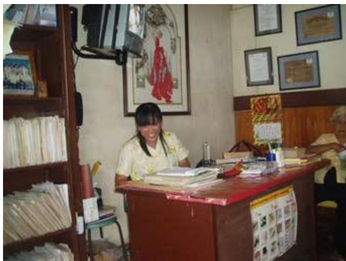
Sköterska i Diabetesklinikens reception.

Så har det nu också blivit med vårt planerade besök till diabeteskliniken i Ozamiz nu den 24 april. Inte att det inte blir av, utan att jag redan varit där, och jag kan nu visa en första rapport om situationen för denna klinik.