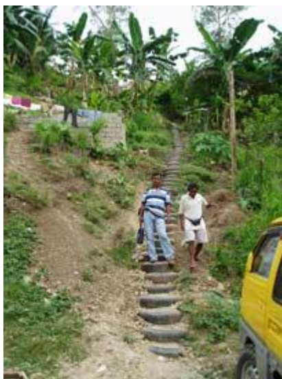
Stegen till himmelen

För att komma till Senonis kyrka, som är belägen på toppen av ett berg i Cagayan de Oro, måste man klättra uppför en trappa med ett stort antal däck gjorda till en stege, som jag kallar ”stegen till himmelen”. Det tar verkligen andan ur en att klättra alla dessa steg och han erkände att han inte har många besökare i sin kyrka.