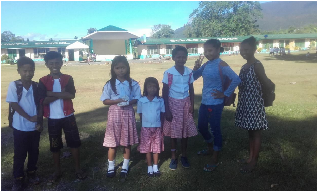
Några av barnen i FTMS skolmatsprogram 2019 samlade på skolgården till Adlays grundskola som har årskurserna F - 6.