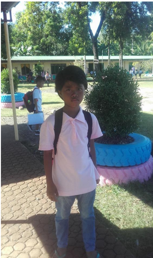
Ny i FTMS skolmatsprogram för läsåret 2019 – 2020 är den här flickan från Mamanwa som nu börjar 5e klass.

Vi hoppas att hon är en av de som kommer att gå vidare till High School när hon börjar sjuan.