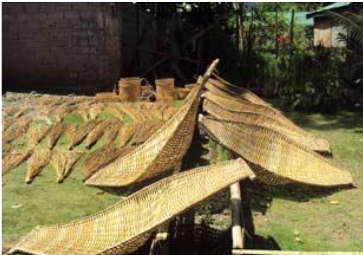
Mamanwa tillverkar produkter av rotting.