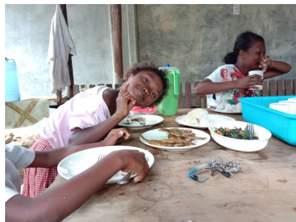
En ny morgon gryr och busiga barn är på väg till skolan.