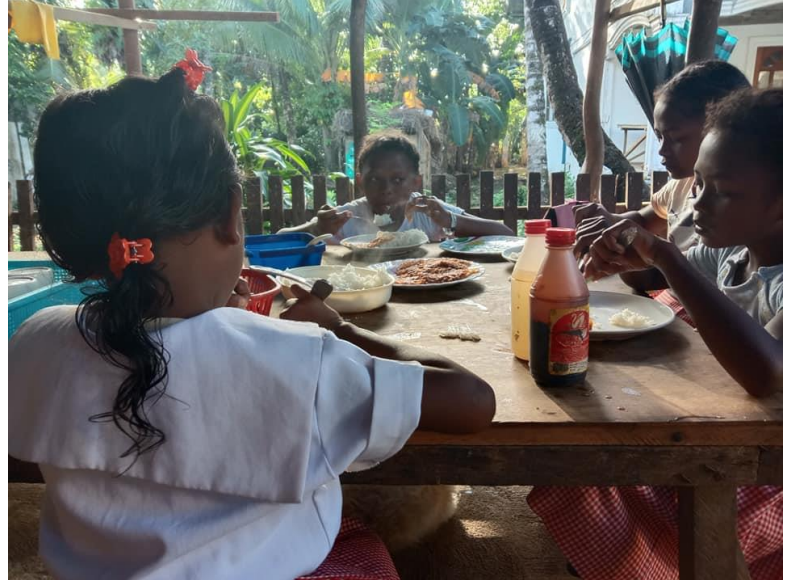
Bilder från februari och mars månad innan pandemin.