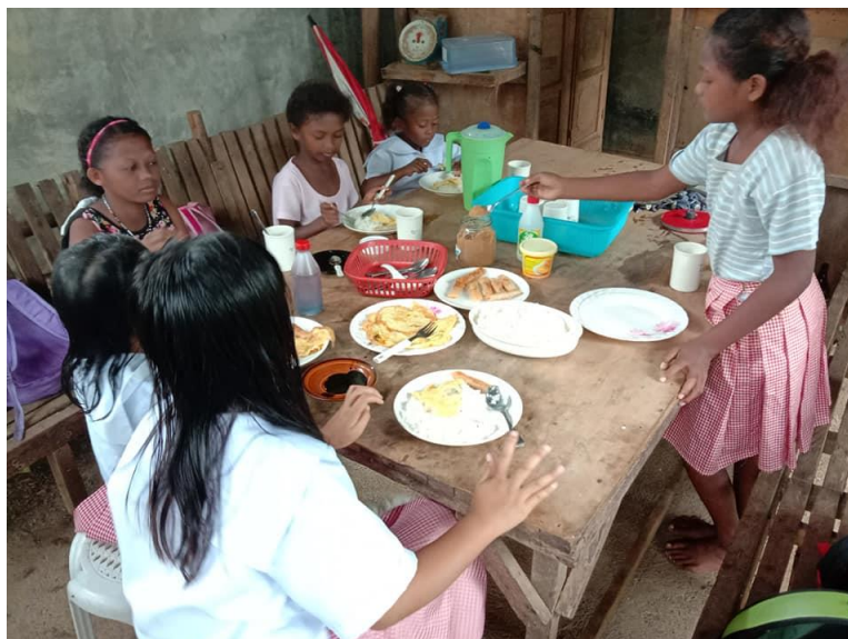
Januari månad 2020