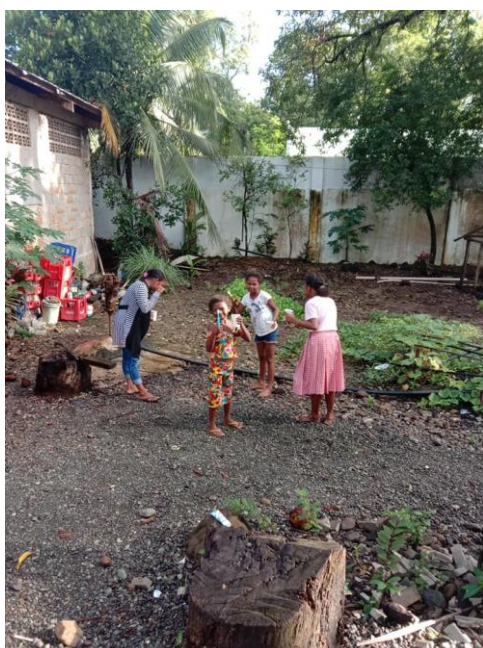
Tandborstning är viktigt efter att ha ätit frukost.